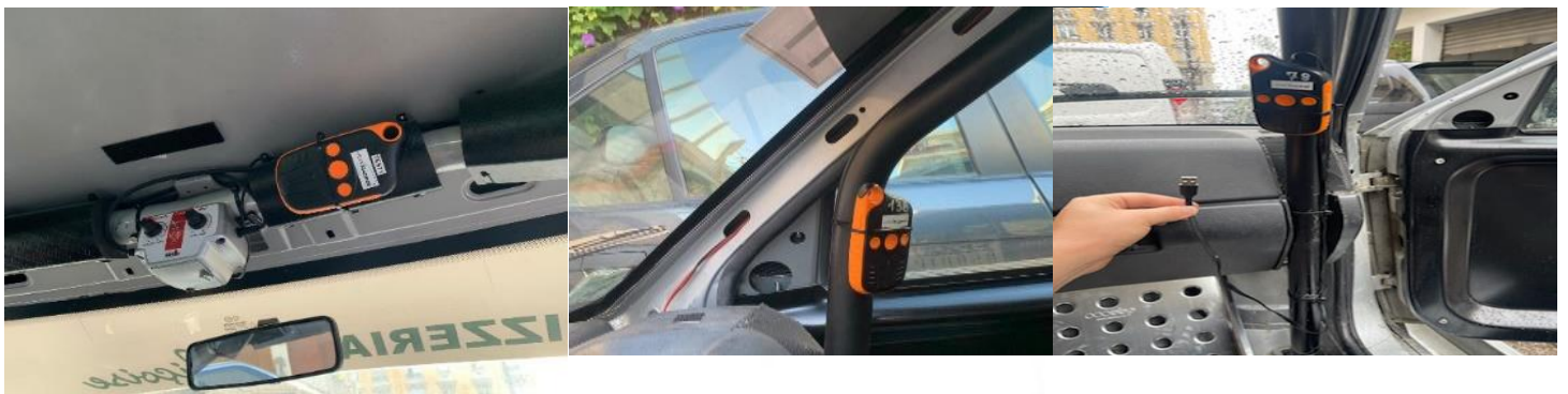
Câble Alimentation fourni par VDS 80 cm

ATTENTION prévoir suffisamment de longueur de câble pour avoir accès aux 2 emplacements obligatoires du boîtier ou utiliser une rallonge USB